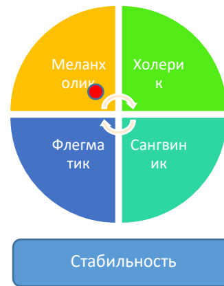
Рисунок 3 – Профиль темперамента испытуемого 2

Таким образом, испытуемый 1 проявил темперамент холерика, его численные показатели по шкале экстраверсии/интроверсии 16 баллов указывают на экстраверсию, а 21 балл по шкале нейротизма наделяют испытуемого эмоциональной неустойчивостью очень высокого уровня.