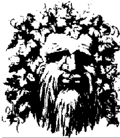
Рисунок 1 – Двойственная иллюзия: Старик или влюбленные

Был выбран стимульный материал – это изображение двойственной иллюзии: «Старик или влюбленные» представлен на рисунке 1.: