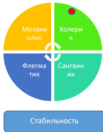
Рисунок 2 – Профиль темперамента испытуемого 1