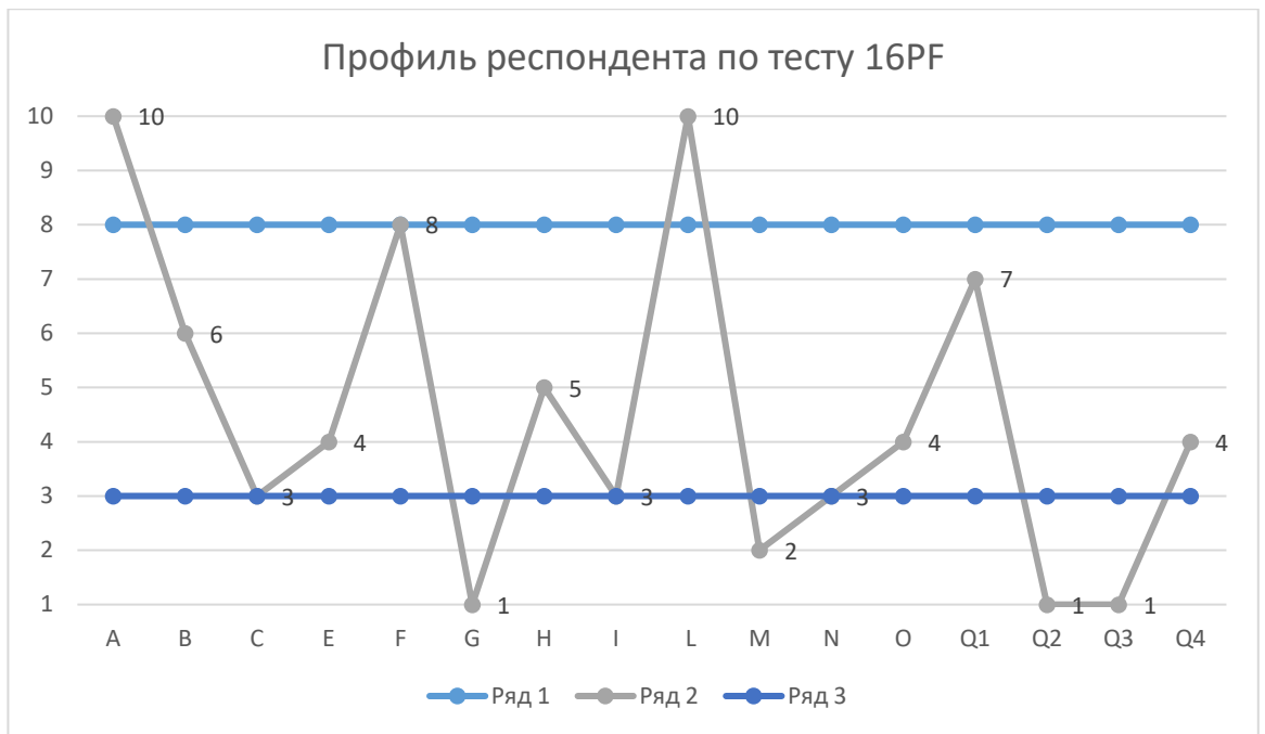
Рисунок 4 – Диаграмма Результаты теста 16 PF

Таким образом, можно диагностировать следующие черты личности респондента: А - Аффектотимия (10); G - Слабость сверх Я (1); L – Протенсия (10); М - Праксимия (2); Q 2 – Социабельность (1); Q 3 – Импульсивность (1). Это первичные факторы, которые в определённых сочетаниях включены в различные блоки. Приведем данные блоки и соответствующие факторы в таблице 4.: